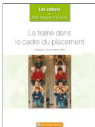
N°1, nov. 2006