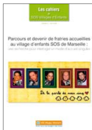
N°3, avril 2008