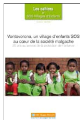
N°4, mai 2009