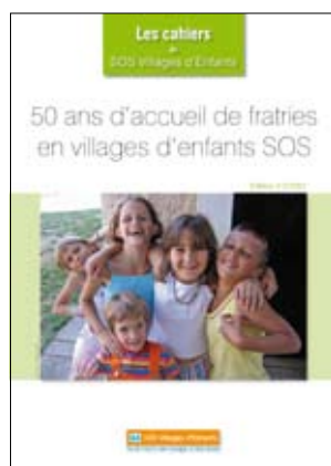
N°2, juin 2007